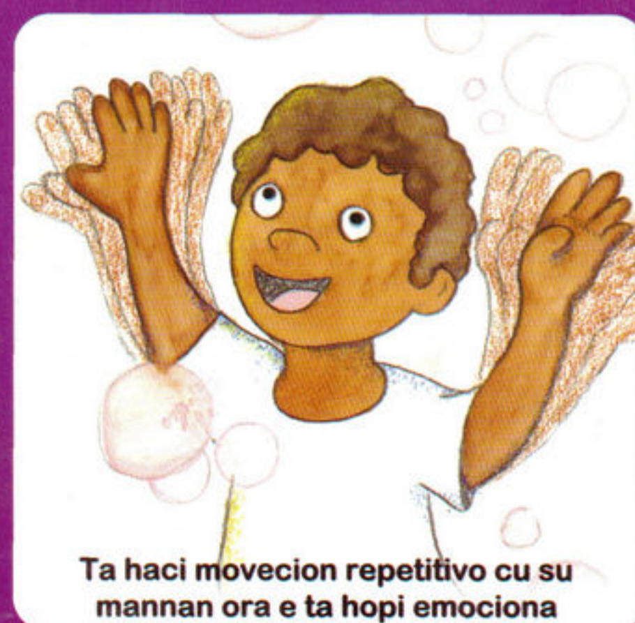
Ta haci movcion repetitivo cu su mannan ora e ta hopi emocionada

Tin diferencia individual ora ta trata di autismo, pero e caracter general di e discapacidad semper ta mescos. Discapacidad specialmente den e contacto social, e comunicacion verbal y no-verbal, den imaginacion mental y un limitacion obvio di interes den actividad. E conductanan ilustra aki riba, por keda manifesta den grado diferente cerca un persona cu autismo. Tambe no ta tur e conductanan, cu a ser muestra, mester ta presente.